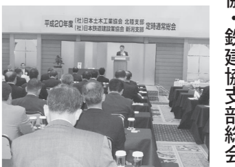
土木協・鉄建協支部総会

6月5日ホテルオークラ新潟で平成20年度(旧)土木協新潟支部(旧)日本土木工業協会新潟支部(第42回)、(旧)日本鉄道建設協会の新潟支部(第38回)の定時総会が開かれた。総会に出席した土木協新潟支部長は、土木協本部が専任理事から両協会支部の21年4月1日に行われる合併についての説明が行われた。