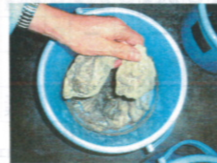
セメント粉末 80%添加