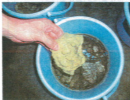
セメント粉末 40%添加