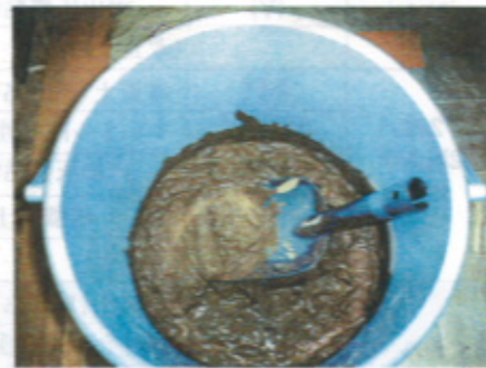
セメント粉末 80%添加