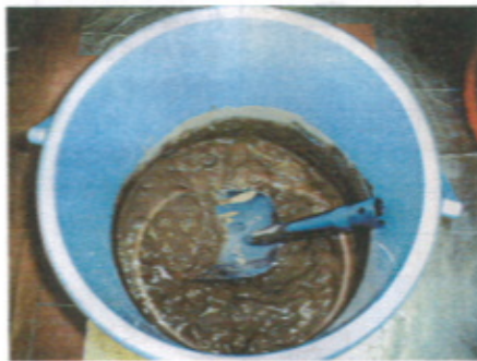
セメント粉末 40%添加